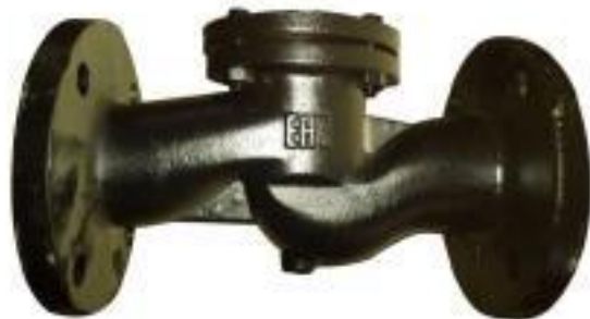
КЛАПАН ОБРАТНЫЙ ПОДЪЁМНЫЙ ЧУГУННЫЙ 16к49нж